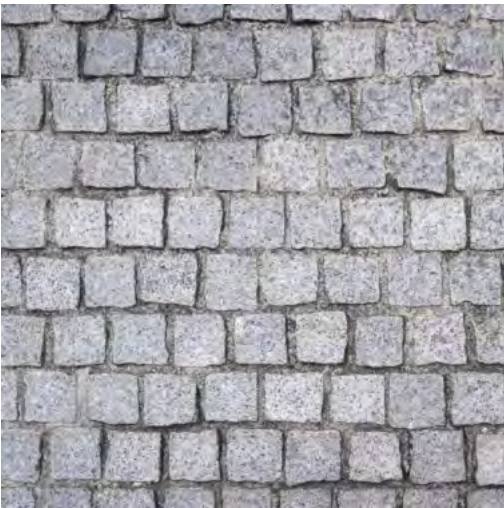
Vorplatz Kopfsteinpflaster vergossen, Pflasterfugenmörtel