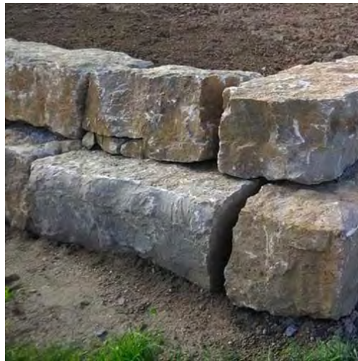
Alternativ Steinquader, Detail 5