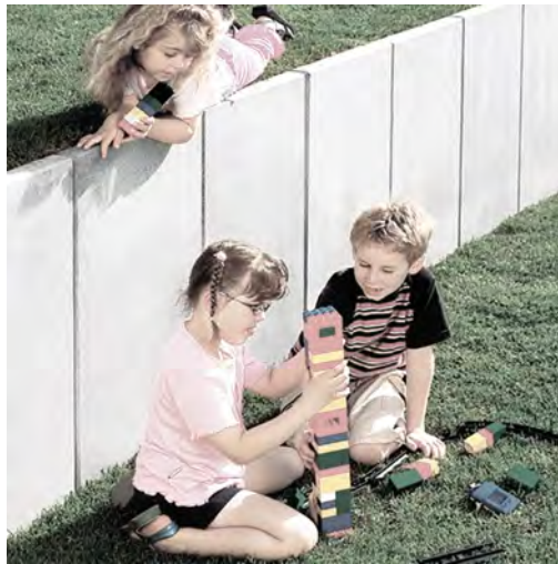
Winkelplatten, Detail 5