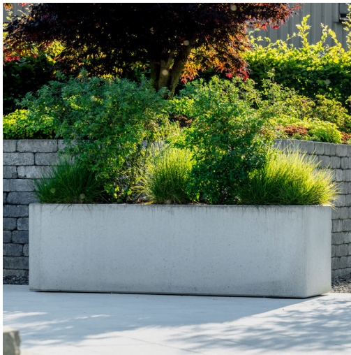
Betontrug, Detail 4